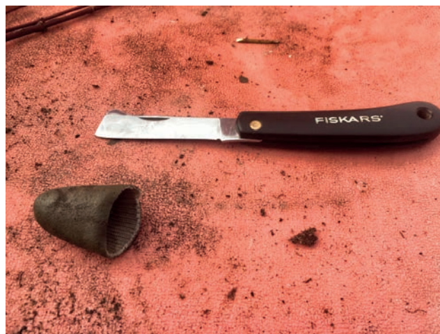
Slika 6. Nožić za tehniku bočnog cijepjenja naoštren samo s jedne strane

Figure 5. The necessarily labeling of each seedling with the correct latin cultivar name is done immediately after grafting