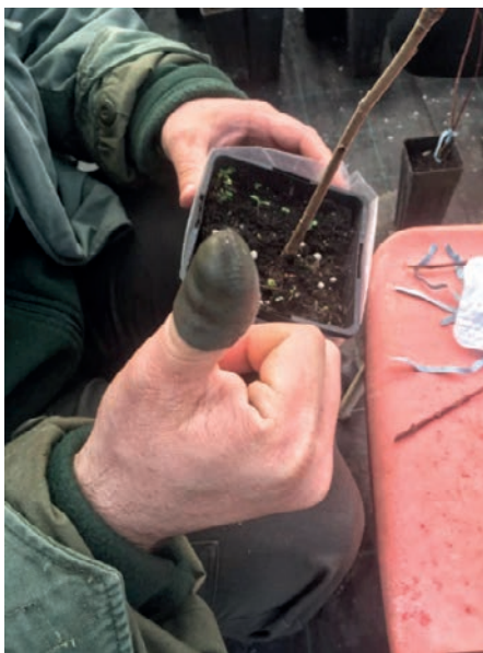
Slika 8. Stavljanje „napršnjaka“ kao zaštita palca od mogućih ozljeda oštrim nožićem

Figure 8. Put on of the “thimble” as protection of the thumb from possible injuries with a sharp knife