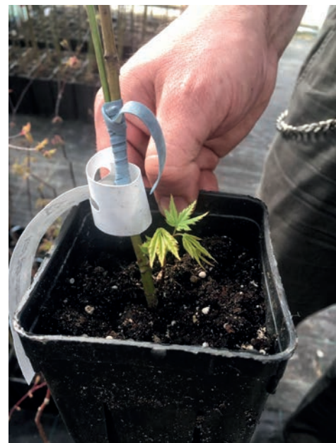
Slika 4. Aktivirani izbojci iz spavajućih pupova ispod mjesta cijepjenja koje treba odmah ukloniti

i pripremiti alat i pribor u što pripadaju voćarski nožić, voćarske škare, precizne škare ili grickalice za skidanje sitnih pupova na podlozi ili plemci koji smetaju pri izvođenju cijepjenja, ali i kasnije čišćenje ili skidanje izbojaka na podlozi ispod mjesta spajanja koji se vrlo često aktiviraju iz spavajućih pupova, a štetni su jer troše biljne sokove i ne raspoređuju je u plemku u dovoljnoj količini (slika 4). O razmnožavanju brojnih ukrasnih formi japanskog javora cijepljenjem piše Stilinović (1987) pri čemu navodi kako je moguće bočno cijepljenje, u kolovozu odnosno u rano proljeće, pod staklom.