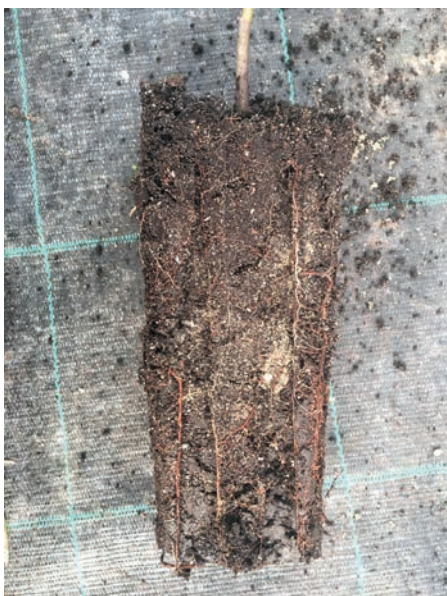
Slika 2. Aktivacija korijena podloge sadnice vrste Acer palmatum vidljiva je po bijelim sitnim korjenčićima

Figure 2. Activation of rootstock roots of Acer palmatum seedlings is visible on white small roots