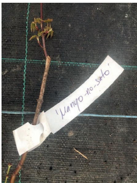
Slika 5. Obavezno stavljanje etikete na svaku sadnicu s točnim latinskim nazivom kultivara obavlja se odmah nakon cijepjenja

Najbolje su bijele etikete zbog manjeg sunčevog zagrijavanja i dulje trajnosti koje su ispisane uz pomoć printera i softvera za pisanje etiketa. Prednosti printanja etiketa su što na njih stane više informacija i možemo ih kreirati po vlastitoj želji (logo institucije itd.) za razliku ako se po njima piše vodootpornim markerom koji se ima negativne strane zbog lošeg rukopisa pojedinih osoba i brisanja slova nakon izlaganja vlazi i ostalim vanjskim čimbenicima. Najboljim