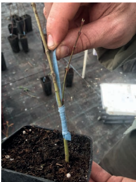
Slika 9. Princip učvršćivanja mjesta spoja podloge i plemke s omatanjem elastičnom gumicom

Figure 9. Principle of fixing the junction of the rootstock and scion with the elastic band wrapper