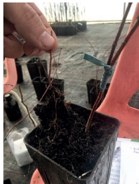
Slika 1. Pročupavanje manje sadnice vrste Acer palmatum u lončiću i ostavljanje deblje kao podloge za cijepljenje

Za uzgoj jednogodišnjih generativnih podloga (oznaka 1+0 ili 1/0) za cijepljenje, klijanci se pikiraju u fazi kad im se razvije prvi par listova normalne veličine. Čupanje klijanaca treba obaviti nakon kišnog razdoblja ili obilnog navodnjavanja. Klijanci se presađuju u centar kvadratičnih (9x9 cm) lončića visine 20 cm i zapremine od 1,4 do 2,0 litre koji se pune mješavinom rasadničkog tla, crnog treseta i pijeska. Prema E.N.A. standardu lončići se označavaju početnom oznakom P iza koje slijedi širina lončića od 5-13 cm, npr. P9 znači širina lončića od 9 cm. Lončići (do 2 l volumena) bi trebali imati otvore na dnu zbog odvodnje suviška vode i sa strane zbog zračnog podrezivanja ili desikacije korijena. Nakon presađnje obavezno je zalijevanje lončića sve dok se