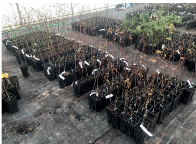
Slika 10. Sadnice japanskih ukrasnih javora snimljene nakon provedenog cijepljenja

Figure 10. Decorative Japanese maples seedlings photographed after grafting