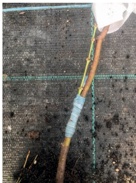
Slika 7. Prikaz zakrivljene podloge i pravilnog (lakšeg) izvođenja cijepjenja na konveksnoj strani

Oštrim krakom reže se rez na podlozi i plemci. Neke osobe rade više s lijevom rukom pa na to treba obratiti također pozornost. Ukoliko nožić nije oštar niti sam rez ne može biti oštar i nije ga moguće napraviti u jednom potezu.