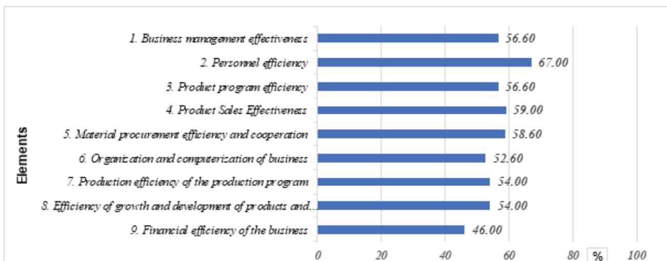
Graf 1. Prikaz indeksa učinkovitosti po funkcijama proizvodnog poduzeća

ženost, likvidnost i poslovna uspješnost . U tablici 1 dat je primjer izračuna dva podelementa i to relativnog iznosa ukupnog prihoda po radniku i relativnog iznos neto dobiti po radniku. Oba iznosa su dali ulazni podatak za izračun ocjene po formuli (2) iz točke 2.2. Tako je ukupni prihod po radniku ocijenjen sa 1,95 , a neto dobiti po radniku sa 2,79 što u prosijeku daje ocjenu poslovne uspješnosti od 2,39 . Inače financijska učinkovitost zamišljenog proizvodnog poduzeća ukupno je ocijenjena po šest navedenih ele-