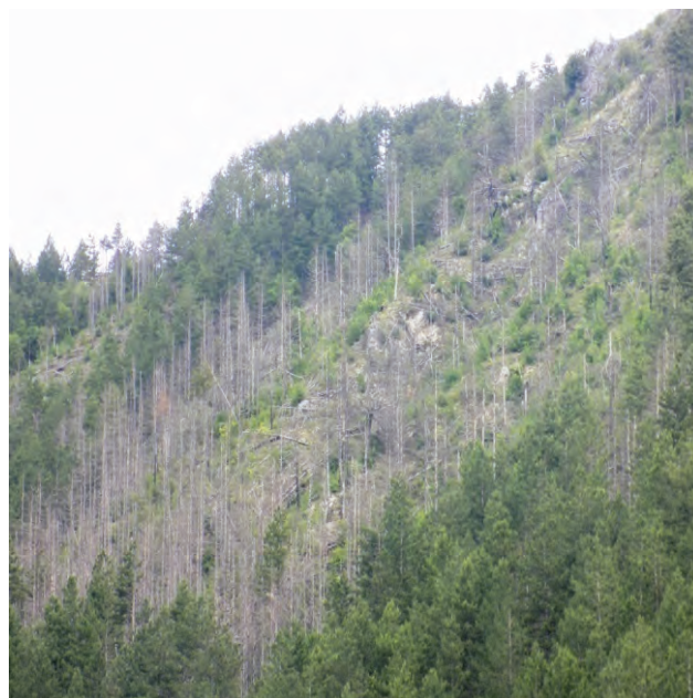
Slika 3 i 4. Sušenje crnog bora usljed jake zaraze imelom; Sušenje sastojina bora uslijed djelovanja imele i raznih abiotičkih čimbenika

Picture 3 and 4. Drying of black pine trees due to heavy infestation trees with mistletoe; Drying of pine stands due to activity of mistletoe and various abiotic factors