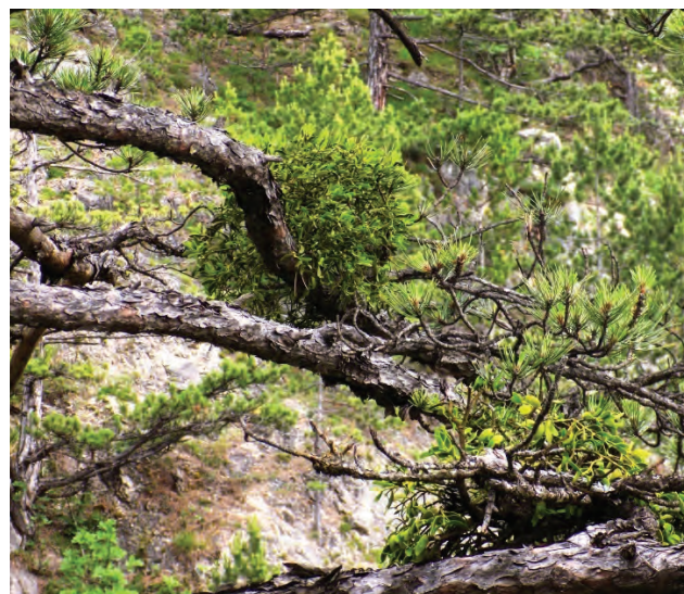
Slika 1 i 2. Grm imele Viscum album subs. austriacum ; Imela na granama crnog bora Picture 1 and 2. Shrub of mistletoe; Mistletoe on a branches of black pine