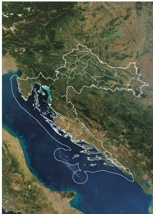
Slika 1. Zemljopisni položaj Uprave šuma Podružnica Senj Figure 1. Geographical location of Forest Administration Branch Senj

Analiza je provedena na području cijele uprave šuma Podružnica (UŠP) Senj. Ova uprava šuma Podružnica sastavni je dio tvrtke Hrvatske šume d.o.o. UŠP Senj podijeljena je na sedam šumarija. To su kontinentalne šumarije Novi Vinodolski, Krasno, Senj i Crikvenica, te otočne šumarije Krk, Rab i Pag. Sveukupna površina UŠP Senj iznosi 224 300 ha, od čega šume i šumska zemljišta zauzimaju 124 645 ha, što čini 55,6 % sveukupne površine. Najveći dio pripada državnim šumama, 111 810 ha ili 90 %, a ostatak od 12 835 ha ili 10 % otpada na privatne šume. U ukupnoj površini državnih šuma 46 % pripada kontinentalnom dijelu, a 54 %