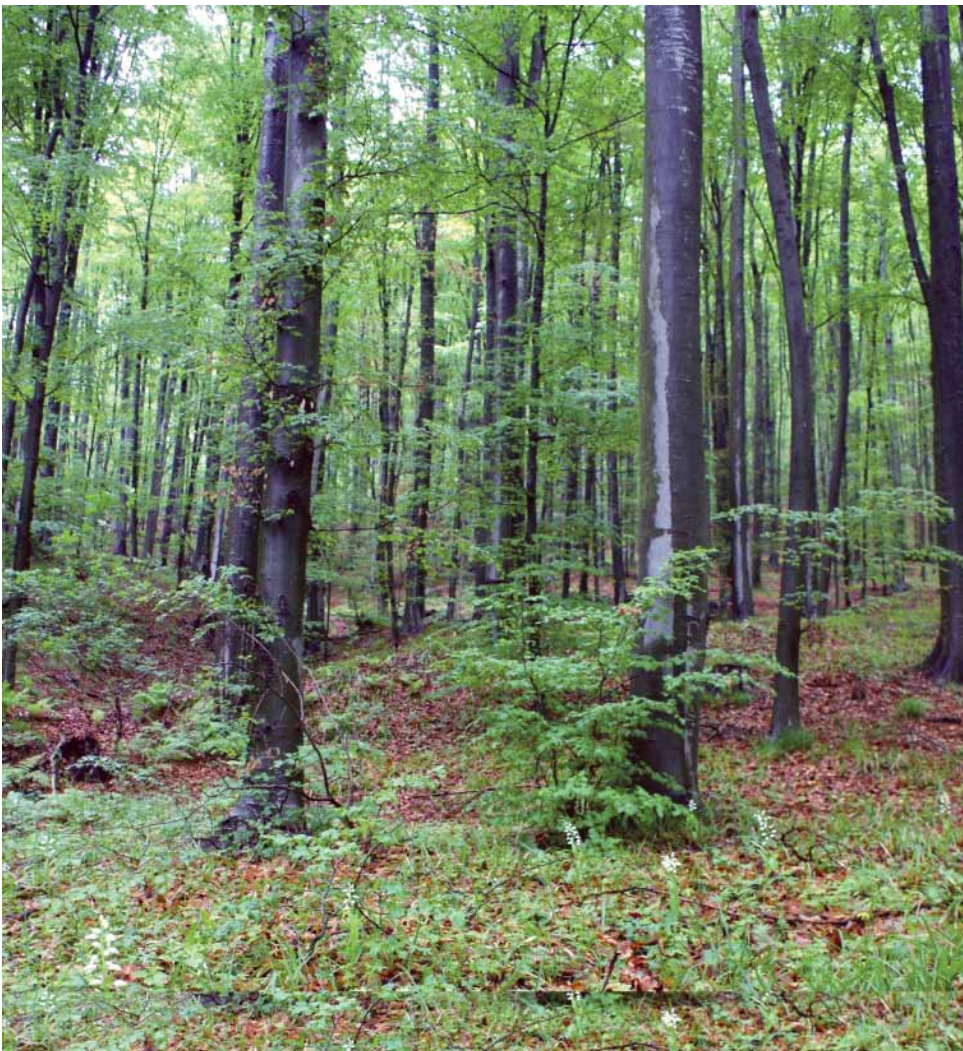
Slika 2. Asocijacija Cephalanthero longifoliae -Fagetum na Papuku

U prizemnom se sloju vrlo često i intenzivno miješaju vrste kolinskih kitnjakovo-grabovih i viših bukovih šuma, što je razlog da je ova zajednica složena za proučavanje i sistematizaciju. Potpunu prevlast imaju Festuca drymeia i Carex pilosa (slika 2), a čitave facijese ponegdje gradi čupava kupina ( Rubus hirtus ), osobito obilna kod jačega otvaranja sklopa. Od ostalih vrsta stalnošću se ističu vrste reda Fagetales , i to Galium odoratum , Lamium galeobdolon , Cardamine bulbifera , Viola reichenbachiana , Pulmonaria officinalis , Dryopteris filix-mas , Lathyrus vernus , Symphytum tuberosum , Mycelis muralis i Circaea lutetiana , a od drugih sinsistematskih kategorija Hedera helix , Melica uniflora i Ajuga reptans . Od ilirskih vrsta stalnija je tek vrsta Ruscus hypoglossum , slabije su zastupljene Cyclamen purpurascens i Vicia oroboides , dok su sasvim sporadično u rubnim dijelovima areala, kao i na lokalitetima miješanja s ilirskim