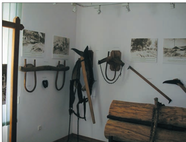
Slika 3. Iskorišćivanje šuma, raznovrsna sredstva rada, soba 2. Figure 3 Forest harvesting, different work equipment, room 2

Gotovo svi eksponati pripadaju iskorišćivanju šuma i sporadično pilanskoj preradi. Na slikama su prikazane pojedine faze iskorišćivanja šuma (sječa, izvlačenje, utovar i prijevoz), područne pilane, te manipulacije drvom u morskim lukama. Na najstarijoj slici prikazano je skladište drva u luci Sv. Juraj 1920. g., pa zatim prijevoz strojeva s volovskim zapregama za pilanu Krasno 1928. g., pilana Krasno u izgradnji 1930. g., pilana u Štirovači 1937. g., te iznošenje ogrijeva iz šume