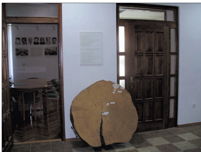
Slika 6. Kolut smreke starosti 410 godina s opisom i oznakom najvažnijih povijesnih događaja (hodnik)

Slike u boji prikazuju nekoliko glavnih vrsta drveća, šumskih zajednica, zaštićenih biljnih vrsta i više nezaboravnih velebitskih motiva. Također se ističu povelje grada Senja 1994. i 2001. g. dodijeljene Upravi šuma podružnici Senj za njezin uspješan rad, certifikat