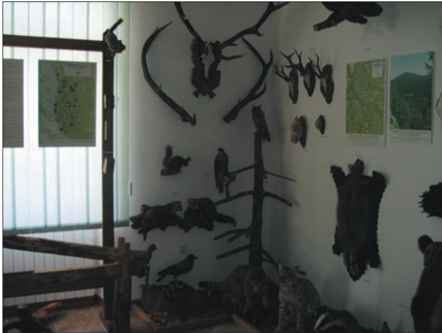
Slika 4. Lovstvo, razne vrste ptica i klopki, soba 3.

trebe u kućanstvu, koje se izrađivalo prostim alatom i priborom. Na uvećanom tekstu opisano je lovstvo visokih šuma i primorskog krša, koje ima dugu i bogatu tradiciju. Početkom 20. stoljeća lovci se udružuju u savez, a uskoro je osnovano Lovačko društvo “Jarebica” u Senju 1930. godine. Prema Zakonu o lovu 1994. g. na području sjevernog Velebita osnovana su četiri lovišta (tri na kršu i jedan najveći “Sjeverni Velebit” na području visokih šuma). Ovim potonjim gospodari Uprava šuma podružnica Senj. U svim lovištima na 46.400 ha obitavaju mnoge autohtone vrste divljači (krupne i sitne)