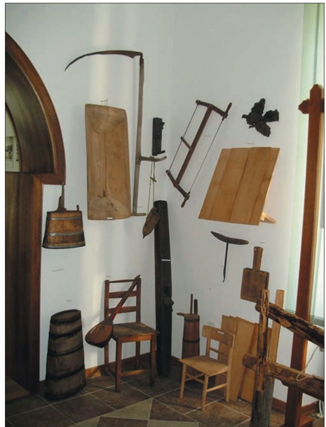
Slika 5. Bogatstvo izrađenih predmeta iz drva za svakodnevnu upotrebu, soba 3.

Na slikama je prikazano više vrsta visoke divljači u prirodnom okolišu. Osim toga, snimljen je trenutak prvog ispuštanja divokoza na sjevernom Velebitu 1978. godine. Također izdvajamo kopiju umjetničke slike “Tetrijev”, rad slikara Karla P o s a v c a, šumarskog inženjera. Na višebojnim kartama prikazano je sadašnje lovište “Sjeverni Velebit” s lokalitetima krupne divljači i divokoza te pjevališta običnog tetrijeba 1934. godine. Ukupno je preparirano 27 izložaka, a od toga 17 sisavaca i 10 ptica. Skupini sisavaca pripada 13 različitih