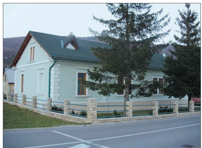
Slika 7. Pogled s ceste na Šumarski muzej u Krasnu Figure 7. View of the Forestry Museum in Krasno from the road