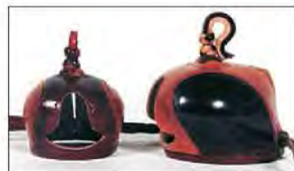
Slika 12. Nizozemski tip kapica