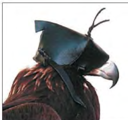
Slika 14. Kazahstanski tip kapice za orla, koji je proizašao iz kulture toga područja.