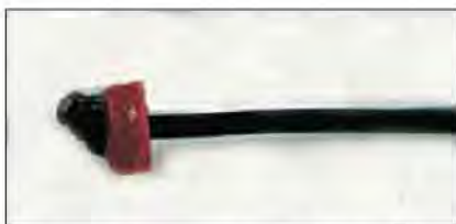
Slika 8. Tip uzice od užeta koji se danas najčešće koristi u sokolarenju.