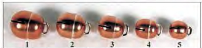
Slika 9. Zvonca koja se pričvršćuju na rep ptice. Na rep se pričvršćuju zato što ponekad ptica koja se nalazi na lovini ima potpuno ukočene noge jer drži lovina te ne čujemo zvono, u tom slučaju se zbog balansiranja na lovini pomiče rep i zvonca zvonči.