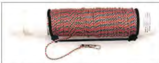
Slika 25. Dugačko i čvrsto uže za trening.