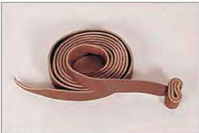
Slika 7. Kožni tip uzice

1.4. Uzica – komad užeta ili kože sa čvorom na kraju. Služi za vezanje ptice za stalak ili dok se nosi na ruci prije leta i lova.