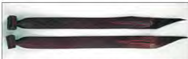
Slika 5. Kožna vezica koja se izvlači iz metalnoga kruga te ptica nesmetano leti i lovi.