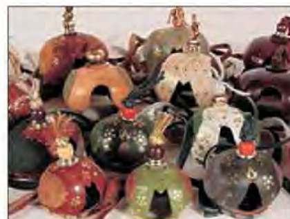
Slika 13. Arapski tip kapica