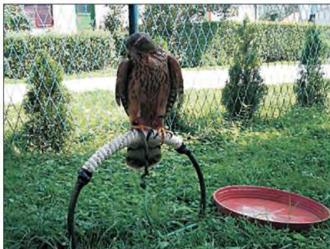
Slika 15. Lučni stalak koji simulira granu koristi se za vrste koji najveći dio svoga života provode u šumama. Na slici se vidi ženka jastreba kokošara ( Accipiter gentilis L.) sa alymeri vezicama, zvoncem, vrtlicom i užetom, na stalku koji odgovara toj vrsti.

1.7.1. Lučni stalci – u obliku luka na koji je namotano uže ili pričvršćena umjetna trava ili neki drugi slični materijal. Oni služe za držanje škanjaca, jastrebova, sova i orlova, zato jer simuliraju granu na kojoj te ptice najčešće borave u prirodi.