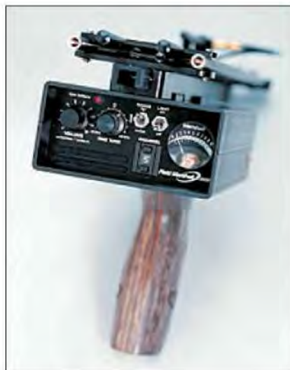
Slika 17. Prijammnik

1.8. Telemetrija – služi za lakši pronalazak sokolarskih ptica koje su otišle daleko za lovinom, ili smo ih zbog nekih drugih okolnosti izgubili. Telemetrijski uređaj sastoji se od prijammnika i antene koji se nalaze kod sokolara te odašiljača koji je pričvršćen za pticu. Pomoć toga uređaja izrazito je velika kod lovnih ptica koje odlaze daleko za lovinom.