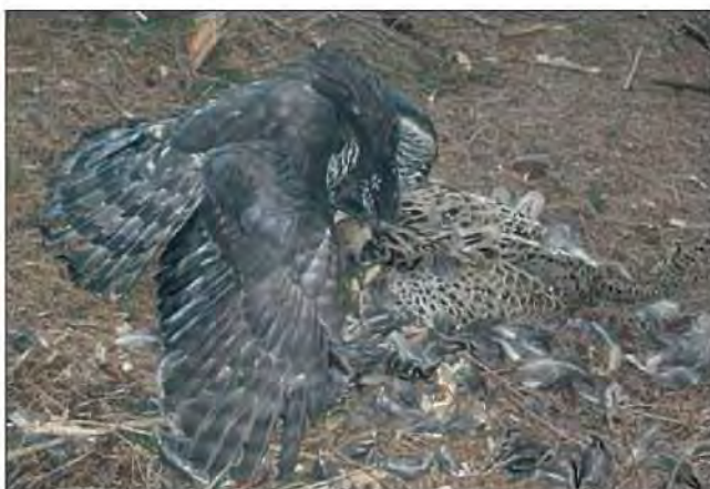
Slika 20. Najbolji način pričvršćivanja odašiljača na pticu je na središnje repno pero. Na slici se vidi da odašiljač i repno zvonče uopće ne smetaju jastrebu kokošaru ( Accipiter gentilis L.) dok lovi.