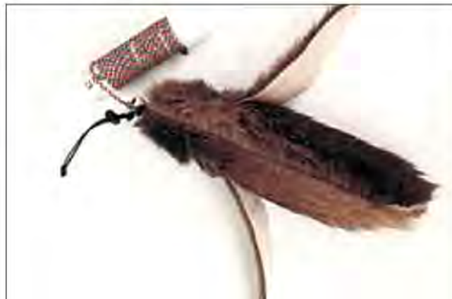
Slika 24. Vabilo u obliku zeca. Vabilo je od velike važnosti kod pozivanja ptice i uvođenje u lov i kondiciju.

3.2. Dugačko uže – 20-30 metara dužine. Služi za osiguravanje ptice koja još nije potpuno trenirana za let i lov.