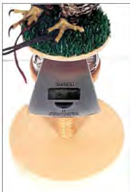
Slika 2. Digitalna vaga

Podjela težina ptica treba biti na: visoku težinu (ako poistovjećujemo težinu i masu), letnu težinu – težina na kojoj će ptica spremno dolaziti po nagradu na ruku ili vabilo, te loviti plijen i nisku težinu.