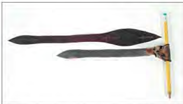
Slika 3. Tradicionalne vezice koje se sastoje iz jednog dijela, te su trajno pričvršćene ptici oko noge. Takve vezice se uglavnom koriste za ptice koje ne love ili su podvrgnute procesu rehabilitacije.

Vezice mogu biti: – tradicionalne – Alymeri – pravi – lažni