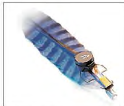
Slika 19. Odašiljač