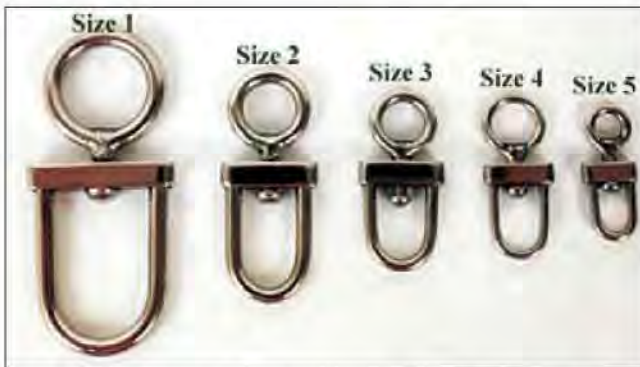
Slika 6. Poznate engleske čelične vrtilice u obliku slova D, danas se najčešće upotrebljavaju u sokolarenju.