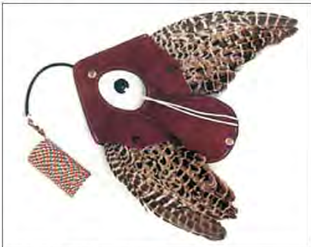
Slika 23. Vabilo sa krilima fazanke.

3.1. Vabilo – je imitacija ptice ili zeca. Služi za uvođenje ptice u lov, pozivanje ptice nakon promašnog pokušaja lova ili za kondicijski trening.