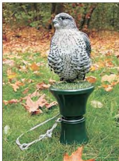
Slika 16. Za sokolove se koriste blok stalci koji simuliraju stijenu.

1.7.2. Blok stalci – u obliku okomito osovljenog valjka na čiju je gornju površinu namotano uže ili pričvršćena umjetna trava ili neki drugi slični materijal. Oni služe za držanje sokolova, zato jer simuliraju stijenu na kojoj te ptice najčešće borave u prirodi.