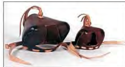
Slika 11. Angloindijski tip kapica

Najčešće se koriste tri vrste kapica: anglo-indijski stil – Anglo-indian , arapski stil – Arabian i nizo-