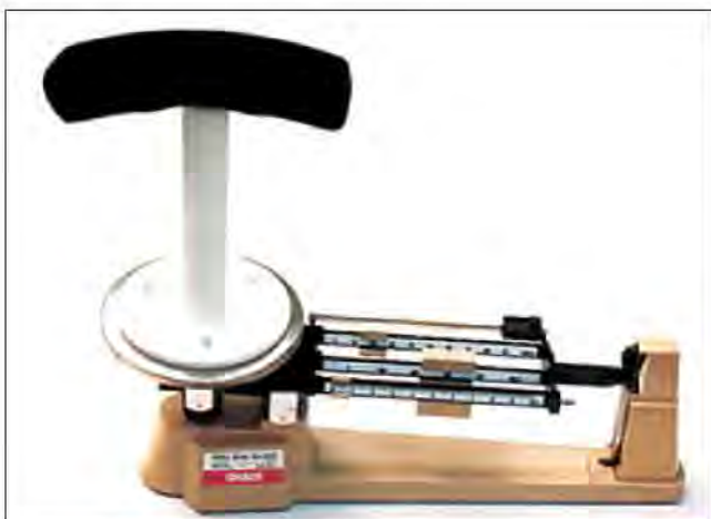
Slika 1. Analogna vaga