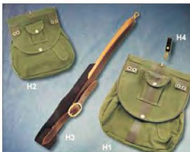
Slika 22. Sokolarska torba služi za držanje potrebnog pribora i lovine.

2.2. Sokolarska torba – služi za držanje hrane, vabila i ostalog pribora potrebnog za pticu i spremanje lovine. Bilo bi dobro da se sastoji od nekoliko pretinaca.