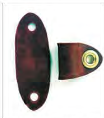
Slika 4. Prvi dio alymeri ili lovnih vezica. Taj dio je trajno pričvršćen oko noge ptice.