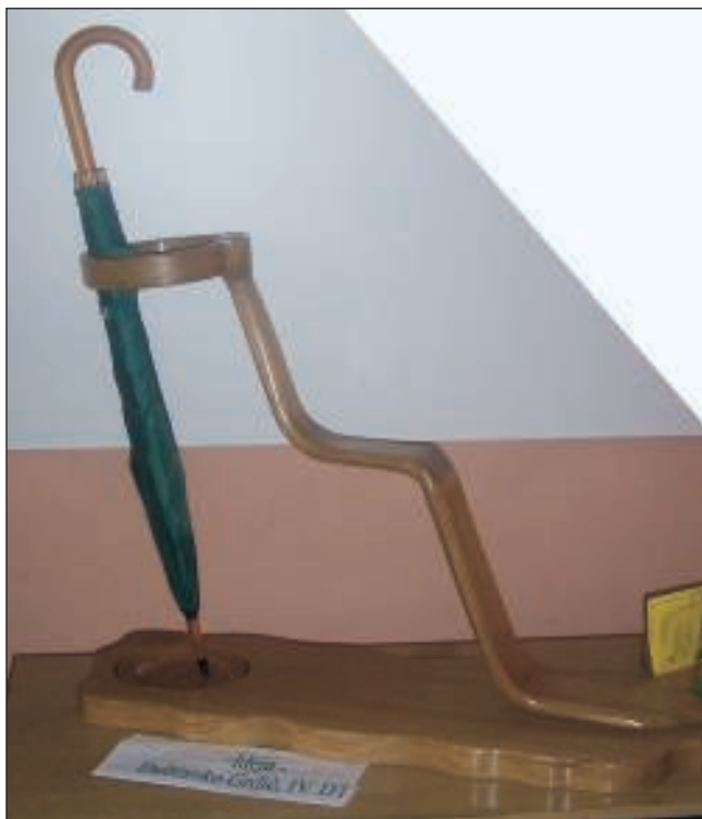
Smotra radova učenika drvodjeljskih škola (lijevo stalak za kišobrane u obliku kravate – “Plitvički slap”)

Ministarstvo znanosti, obrazovanja i športa opremilo je 7 škola (Zagreb, Rijeka, Karlovac, Varaždin, Virovitica i Vinkovci i Split) CNC opremom za obradu drva. Svaka škola dobila je elektronski vođen obradni centar, kantericu, malu sušionicu te kompjutorske učionice i odgovarajuće kompjutorske programe, a škola u Zagrebu i raskrajač ploča. U tijeku je stavljanje opre-