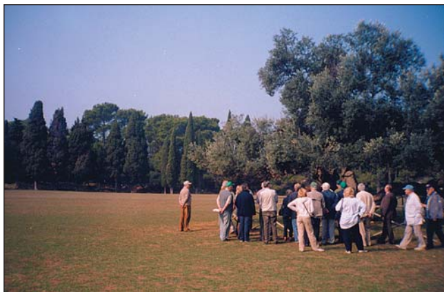
Slika 4. Veli Brijun – grupa izletnika okupljena oko masline stare 1600 g.

Brijunski otoci, njih ukupno 14, površine 736 ha (Veli Brijun ima površinu od gotovo 700 ha), ukupnog opsega od 46,6 km, predstavljaju veličanstveno djelo prirode i čovjeka koji je oblikovao tu ljepotu prirode,