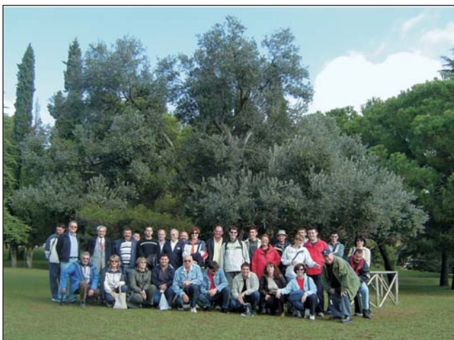
Slika 1. Brijuni, ispred stare masline