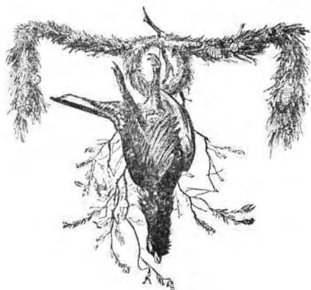
Slika 3. Tetrijeb gluhan, mrtva priroda; učestalo korišten crtež nepoznatog autora kao vinjeta na stranicama lista Figure 3 Capercaillie, still life; a frequently used drawing of an unknown author as a vignette on the pages of the journal

Prvih sedam godišta "Posavski lovac" tiska se u velikom A 4 formatu (29,5 x 21 cm), a posljednje godišta (1931) u formi džepnog malog formata dimenzija 23 x 15 cm. Tiskala ga je Knjigotiskara i knjigovežnica A. Schliff i dr. u Vinkovcima. Uz izlaženje lista Uredništvo je za svoje pretplatnike posredovalo pri nabavi lovačkih pasa, rasplodne divljači, popravci i nabavi oružja, montaži lovačkih trofeja i sl., a obavljalo je i distribuciju vlastitih i tuđih izdanja knjiga i brošura. Iako je "Posavski lovac" bio službeno nezavisno stručno glasilo Kraljevine S.H.S.-a (od 1931. Kraljevine Jugoslavije!) od vremena do vremena svoje je stranice ustupalo "lovačko ribarskim interesima Saveza lovačkih društava Bosne i Hercegovine".