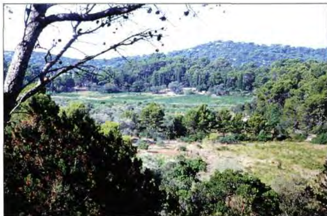
Slika 1. Zapušteni dio polja Pomjenta Fig. 1 Abandoned parts of a field in Pomjent

Stariji stanovnici koji su i u mladosti vatrom uklanjali korov, najčešće izazivaju požar, a vrlo često postaju i njegove žrtve.