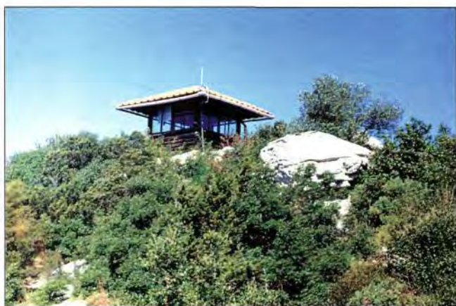
Slika 4. Promatračnica Montokuc Fig. 4 Observation post Montokuc

3. 2. Stvaranje pozitivnog odnosa prema vegetaciji kako kod domicilnog stanovništva, tako i kod posjetitelja, a posebno kod djece, izuzetno je važno za zaštitu od požara otvorenog prostora. Nerijetko čujemo da navedene šume i šumska zemljišta ne vrijede ništa, da od njih nema nikakve materijalne koristi pa je često i odnos prema istima u skladu s takvim razmišljanjima. Samo stalna cjelogodišnja promidžba; razna predavanja, edukacija djece svih uzrasta, plakati, razne znanstveno-popularne i turističke brošure, natjecanja i kvizovi, a posebno promidžba putem elektronskih medija, najdjelotvorniji su način za prevladavanje navedenih zabluda.