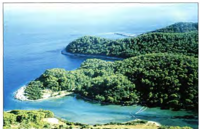
Slika 3. Turistički zanimljiv prostor Fig. 3 Areas interesting for tourism

2. 7. Šumarska struka koja je često najpozvanija za rješavanje ovih problema, posebice kada je riječ o šumi i šumskom zemljištu, nedovoljno je zastupljena, a često i marginalizirana u preventivi, a osobito kod gašenja požara otvorenog prostora, tako da se njena uloga uglavnom svodi samo na procjenu šteta. Nerjetko se događa da se ne prizna procjena koju rade šumari, već procjenu napravi netko drugi koji samo navede cijenu gašenja i štetu na izgorjelom drvu, tako da je na-