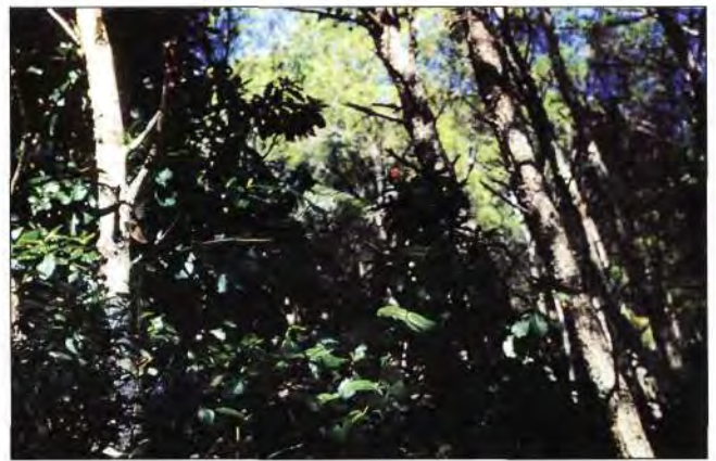
Slika 2. Gusta šuma alepskog bora Fig. 2 Dense forests of Aleppo pine

Postoji još jedan veliki problem kojemu se ne posvećuje dovoljno pozornosti: gašenje požara otvorenog prostora u unutrašnjosti i gašenje požara na otocima i