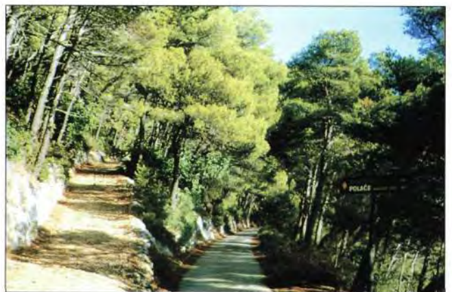
Slika 7. Šumski protupožarni put Fig. 7 Forest fire line

3. 6. Zakonom prisiliti neodgovorne koji još uvijek nisu izradili kvalitetne procjene ugroženosti od požara i planove gašenja da to naprave u najkraćem roku, te da se kroz navedene dokumente precizno odredi uloga svih koji su se dužni uključiti u preventivu i gašenje