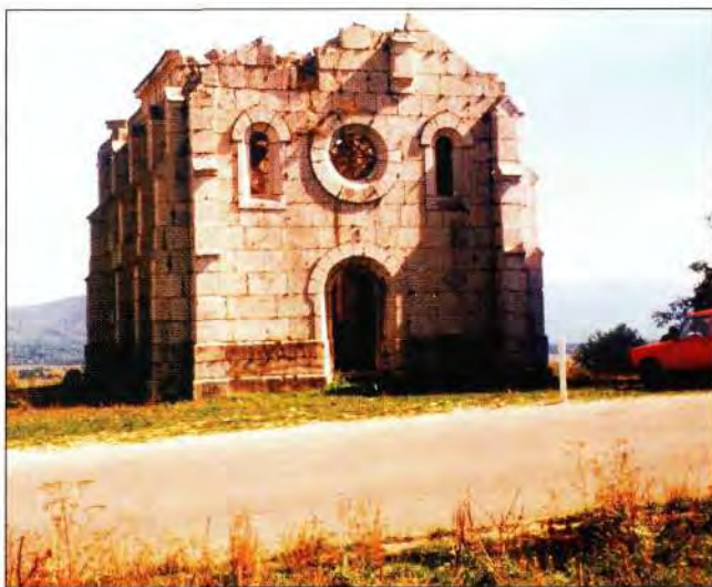
Slika 3. Crkva Sv. Rođenja Blažene Djevice Marije u Buniću, koju je sagradilo Ratno ministarstvo iz Beča 1864. god. i to od zaklade u spomen Laudonu. Na tom mjestu je bila stara kapelica sagrađena 1743. god. u kojoj je sahranjeno dvoje djece generala Laudona, koja su umrla od šarlaha.

Laudon je otišao iz Bunića 1756. god. s činom majora, a narod je u njegovu čast za sve dobro što je učinio za ovaj kraj hrastovu kulturu na živim pijescima nazvao njegovim imenom "Laudonov gaj".