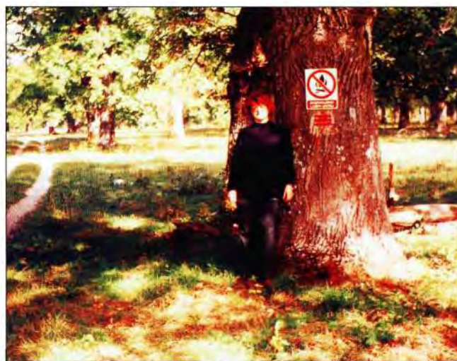
Slika 2. Laudonov gaj odjel 16a. Stari hrast lužnjak kojega je posadio general Laudon 1746. god.

Kulture su podizane uglavnom s listačama, među kojima je glavna vrsta bio hrast lužnjak ( Quercus robur ). Pošumljavanja se nastavljaju idućih godina i stoljeća posebice na Krbavskom polju, radi umirivanja živih pijesaka.