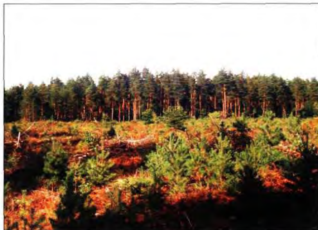
Slika 4. Laudonov gaj odjel 1a i b, kultura običnog bora posadena 1895. god. Odsjek b je posjekao okupator u Domovinskom ratu, a Šumarija Korenica je isti obnovila nakon Oluje 1966. god. s hrastom lužnjakom i običnim borom.

Najviše oborina padne u proljeće i jesen. Godišnji prosjek za Stipanov grič iznosi 1204 m/m, a za Korenicu 1251 m/m.