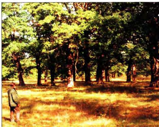
Slika5. Laudonov gaj odjel 16a, kultura hrasta lužnjaka na živim pijescima, posadena 1746. god.

Danas je ta sastojina hrasta lužnjaka stara 255 god., sa 17 stabala po ha ili 554 stabla. Srednji promjer d - 1,30 m iznosi 89,4 cm, s prosječnom visinom stabala 23 metra, ukupnom drvnom zalihom od 4.235 m 3 . Godišnji tečajni prirast iznosi 0,50 m 3 /ha, s postotkom prirasta od 0,38%.