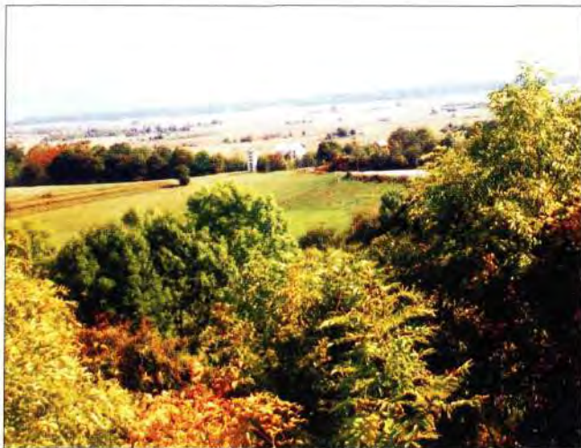
Slika 1. Panorama Krbavskog polja, sa pogledom iz Bunića na Laudonov gaj

Povijesna građa Laudonova gaja uništena je u ratovima i nije sačuvana.