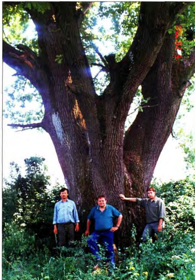
Slika 2. Pojedini primjerci hrasta lužnjaka u ritskim šumama znatnih su dimenzija. Hrast lužnjak uz nasip u Slatinskim nizinskim šumama.