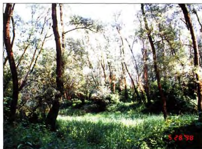
Slika 4. Karakteristični izgled mješovitih vrba i topola u Slatinskim podravskim šumama

Glavna diferencijalna vrsta je plava kupina ( Rubus caesius ), a uz nju su u sloju prizemnog rašća česte vrste: kopriva ( Urtica dioica ), dobričica ( Glechoma hederacea ), vučja noga ( Lycopus europaeus ), rastavljeni šaš ( Carex remota ), milava ( Calamagrostis epigeios ), divlji hmelj ( Humulus lupulus ) itd.