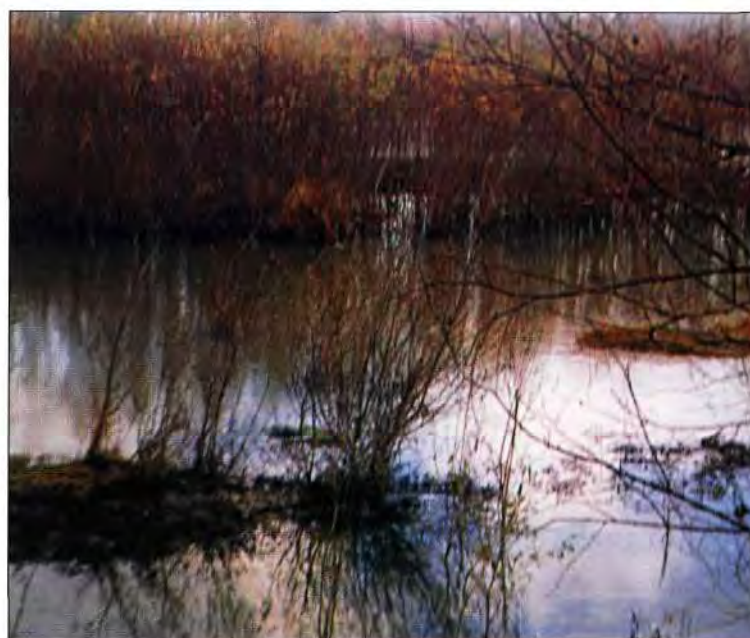
Slika 1. Poplave u ritskoj šumi su česte, studeni 1998.

Srednja godišnja vlaga zraka iznosi 82 %.