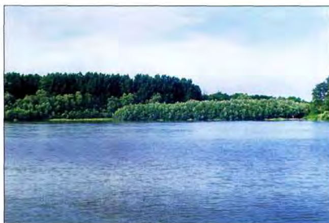
Slika 5. Sukcesija ritskih šuma na dravskim otocima - odjel 5c

Opstanak kultura, posebno euroameričke topole i vrba, neće doprinijeti očuvanju genofonda domaćih to-