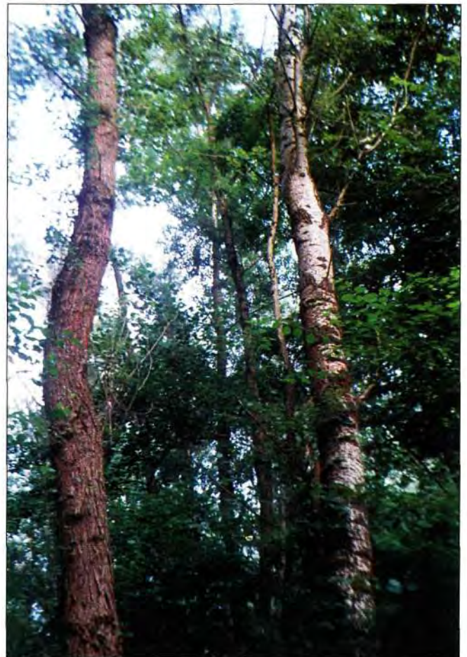
Slika 3. Šuma crne i bijele topole - odjel 8c