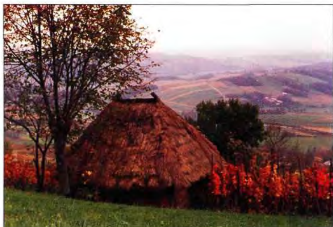
Slika 6. Stisla se, a ipak vlada.

cijeniti, vrednovati, održavati. Gorice , dakle vinograd, i vinogradarstvo, jedno od glavnih zanimanja Prigorja, Zagorja, Podravine, Međimurja, uvjetovalo je i osebujnu, prepoznatljivu arhitekturu kleti. Specifični gospodarski objekt formiran za proizvodnju mošta, vina i poslove vezane uz vinograd, predstavlja nadopunu kućnog stambenog prostora.