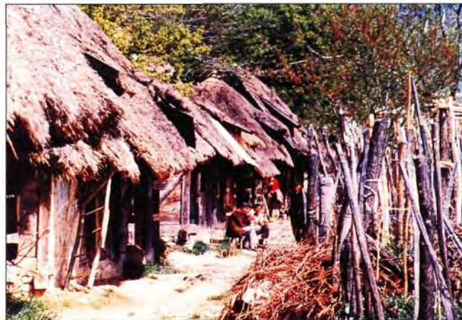
Slika 3. Stare Obreške kleti (snimljene 1984. godine).