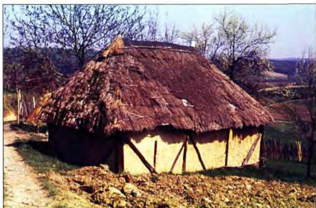
Slika 12. Klet snimljena u zaseoku Crkvenjak iznad Glogovnice, jedna je od brojnih kleti koje daju ugođaj vinorodnim brežuljcima na putu od Gornje Glogovnice prema Sv. Heleni. Građena je na kanate i zadržala je svoj tipični lagani slamnati pokrov.

Uz kalničke vinograde, ovisno o običaju kraja i uvjetima, naći ćemo šljivu bisticu, vinogradarsku breskvu, a uz kleti staru krušku, jabuku, orah, trešnju, ali i samoniklo raslinje koje u svako godišnje doba daje poseban ugođaj.