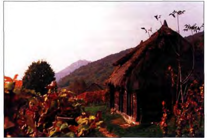
Slika 22. Klet ispred glavnog grebena Kalnika “El ljubav i srce nam ne nišće odnesel s te grude zemlje, zagorske, svete ...?”

na jednostavnost neda se banalizirati. Svaka od njih je jedinstvena, a zajedno čine skladnu cjelinu uklopljenu u prostor i vrijeme. Ako želimo sudjelovati u stvaranju normi ponašanja i podizanju kvalitete života na temelju svoje tisućljetne kulture i tradicije, onda ne smijemo dopustiti da nam ta kultura propada. Poštujemo ostva-