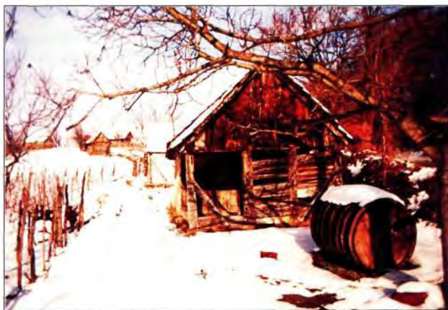
Slika 19. Uz cestu "Križevci-Kalnik".

Svaki kletar iz svoje kleti uzme flašu vina i uputi se u prvu klet kojoj su vrata otvorena (većina ih nema prozora) i u kojoj se loži vatra, tako se sakupe susjedi svaki sa svojim vinom i vijećaju uz vatru, nađe se pokoja prga suhoga sira, malo slanine ili kobasice, ponekad cijelo društvo nastavi do druge otvorene kleti i tako "od poceka do poceka" 10 . (slika 19)