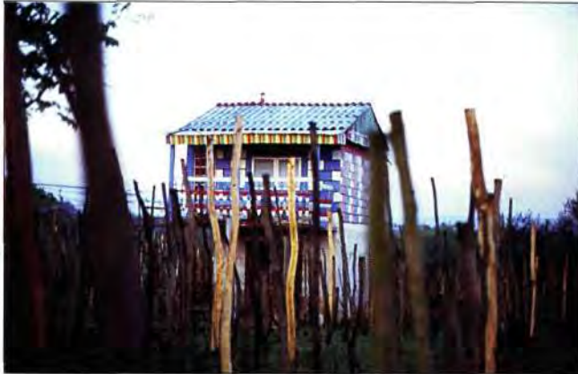
Slika 21. Sigurno da ovakvom gradnjom ne smijemo biti prepoznatljivi, bolje ne.

Klet nije samo građevina koju je moguće rekonstruirati, ona čini ambijent, ugođaj, način života i način mišljenja. U njoj nema imitacije i kiča. Njena profinj-