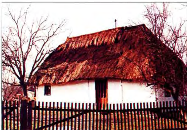
Slika 2. Uspješna obnova stare kuće (hiže); niska, zidana, pokrita slamom, omazana blatom i obijeljena iznutra i izvana. Snimljena u Sv. Petru Orehovcu 1996. godine.

“Suživot staroga i novoga započinje tek kada i ostaci stare baštine dobiju istu perspektivu kao i ono novo. Na nama je stvarati uvjete za takav život.” (slika 1)