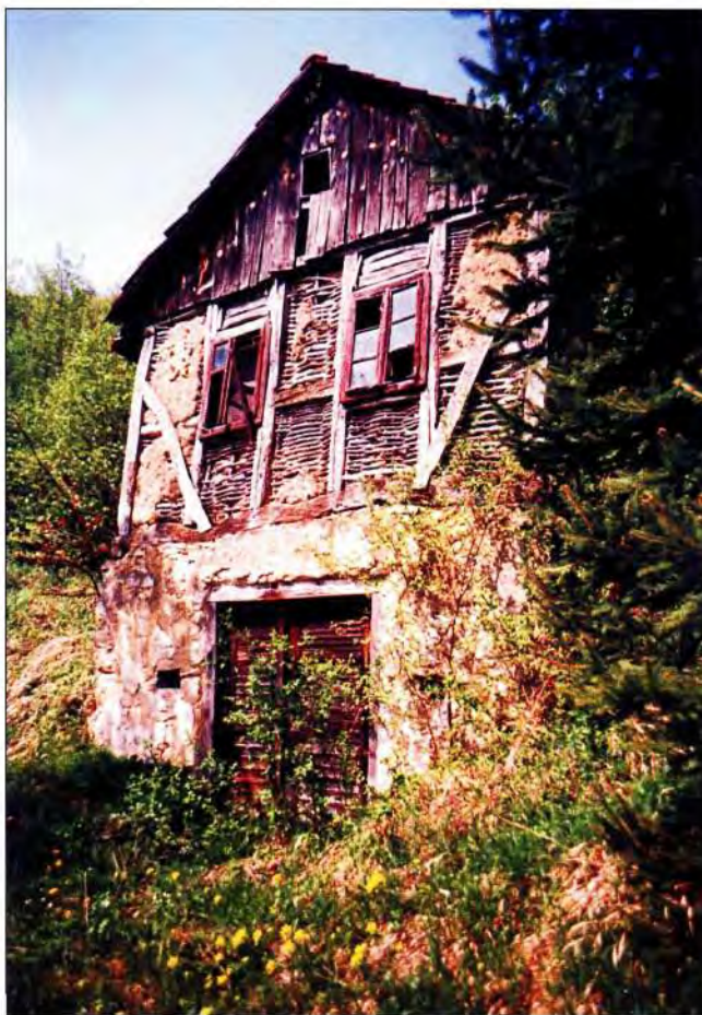
Slika 13. Klet iznad Vojakovačkog Osijeka- podrum od kamena, iznad podruma pleter omazan ilovačom.

A. Muraj piše "No krov nije pokrivaio svaki seljak sam, već bi taj posao povjerio krovcu . Bili su to spretniji seljaci, koji su vještinu pokrivanja krovova usavršili kao svoju specijalnost, a sav alat sastojao im se od željezne kuke za provlačenje, žljebaste daske za sabijanje i izravnavanje krovne plohe, te elastičnih šiba za pričvršćivanje. Snop po snop ritka (snopovi slame) vezali su o letve užetom, usukanim od slame, radeći od donjeg ruba strehe prema sljemenu. Načinom, što su ga usvojili kasnije, ovako rasprostrtu slamu učvršćivali bi još štapovima, koje su prekrivali narednim redom slame, tako da nisu bili vidljivi. Možemo ih razabrati tek na krovovima koji su već oštećeni. Lijepo izgledaju bridovi streha, jer su na mnogim krovovima oblikovani stepeničasto, a također i sljeme, izvedeno slamom pletenom poput pletenica, sa valjkastim završecima na rubnim točkama -tzv. puranima . Trajnost takvih krovova iznosila je 50-60 godina".