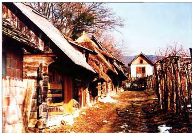
Slika 4. Tesane planke zamijenjuju se piljenima, raženi krovovi eripjekom, salonitom, raznim pločama. Dok su se ranije reške zatvarale ilovačom pomiješanom s pljevom, danas se rabi lakši no estetski neprimjeren način zatvaranja međuprostora između planki (cementom, daskama). Ujedno je vidljiv i nesklad uzrokovan neuspjelom interpolacijom objekta. (Obreške kleti snimljene 1996. godine).

Danas graditeljstvo dobiva svoje sve savršenije, racionalnije i svrsishodnije oblike, a gubi onu prividnu nepažnju, graditeljsku ljepotu stoljetnog predajnog slobodnog graditeljstva, sraslog s prirodom i čovjekom. Pri tomu, nove građevine uglavnom gutaju najvrijedniju savršenost; samu prirodu. (slika 5)