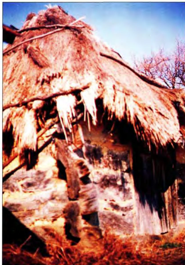
Slika 9. Starica.

Prividna nepažnja gradnje daje ljepotu slobodnog graditelja, što posebno dolazi do izražaja u gradnji uglova - vugliča kleti, koji su konstruirani tako da krajevi planke, koje su umetnute jedna u drugu, slobodno strše u prostoru. (slika 8) Ovakav način spajanja naziva se još i Hrvatski vez, "rustičan i snažan u strukturi" kako piše Maroević. Drvo, golo drvo izloženo šibanju vjetrova, sunca i kiše, mraza i snijega; odolijeva i prkosi, da bi u sunčanim podnevima i večerima pokazalo svu svoju ljepotu vlaknaste strukture, svoju prolaznost u trajanju. Gradeći, taj naš seljak ugradio je sebe u tu klet, dajući joj nešto svoje, prepoznatljivo. Svaki detalj možemo doživjeti kao umjetničko djelo, skulpturu u kojoj je izražena snaga drveta (ili podatnost ilovače) iskazana energijom narodnog tesara. (slika 10)