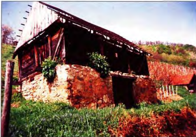
Slika 14. Klet iznad Vojakovačkog Osijeka- kameni podrum, iznad nje drvena klet.

Najpoznatija i relativno sačuvana grupacija starih vinogradarskih kleti pod Kalnikom su Obreške kleti, takozvana Ilica, između sela Vukovca, Hižanovca i Obreža. Položaj pruža mogućnosti korištenja infrastrukture i prednosti novih, modernih i uređenih kuća ovih sela, s ladanjskim, rustikalnim, distanciranim ugođajem starine (slika 3). Na hrptu brijege s kojeg se spuštaju vinogradi, poredane su uglavnom drvene vinogradarske kleti, građene horizontalnim slaganjem tesanih dasaka- planki koje se spajaju na različite načine. Iza starih se kleti nalazi drvored klenova. Cijelo je naselje skladno sraslo s prirodnim okolišem; vinogradima, voćnjacima, poljima i masivom Kalnika. Zbog toga su ove vinogradarske kleti 1980. godine zaštićene kao značajan spomenik narodnog stvaralaštva. U vrijeme boravka ECOVAST 2 -ove grupe stručnjaka, u Križevcima je nastao prijedlog za obnovu obreških kleti. Kleti su nastale u različito vrijeme, uglavnom početkom 19. stoljeća, i kao takve pružaju uvid u način života potkalničkih seljaka, područje duhovnog, socijalnog i materijalnog stanja. Najstarije kleti izgrađene su od ručno tesanih 3 planki, novije od piljenih, a najnovije od različitog materijala, ne poštivajući tradicionalan način gradnje te tako uništavajući ovaj spomenik pučkih postignuća svjedočeći o ukusu i kulturi graditelja (slika 4).