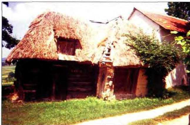
Slika 1. U očekivanju ... (Obreške kleti snimljene 1997. godine)