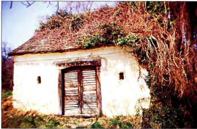
Slika 16. Klet iznad sela Potok.