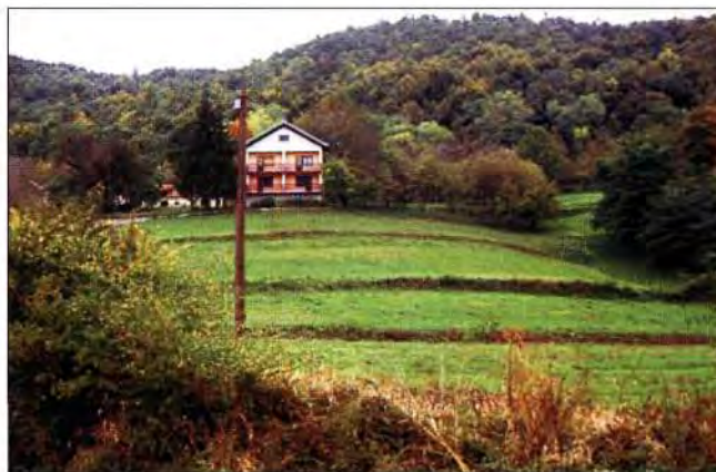
Slika 5. Sinovi i kćeri nalaze se u gradovima (trbuhom za kruhom), neki će svoje mučno zaradene novce uložiti u ovakve građevine želeći se iskazati.

Danas graditeljstvo dobiva svoje sve savršenije, racionalnije i svrsishodnije oblike, a gubi onu prividnu nepažnju, graditeljsku ljepotu stoljetnog predajnog slobodnog graditeljstva, sraslog s prirodom i čovjekom. Pri tomu, nove građevine uglavnom gutaju najvrijedniju savršenost; samu prirodu. (slika 5)