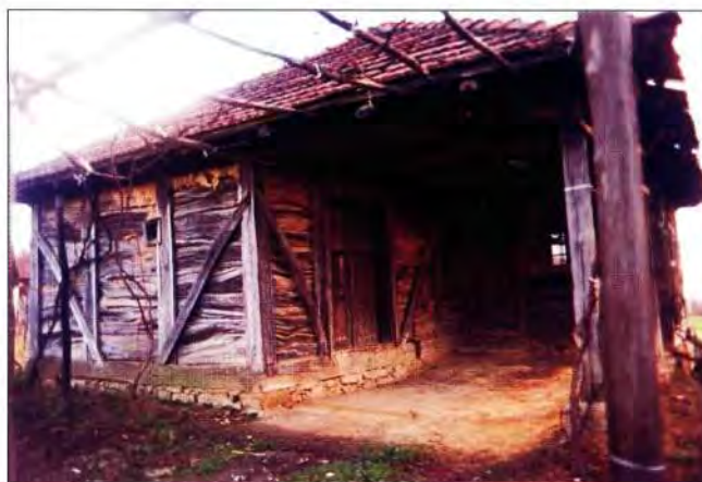
Slika 7. Med vušake - klet iznad Sv. Helene