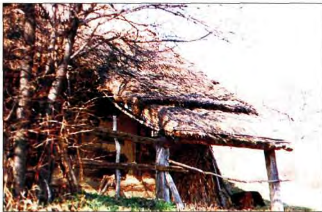
Slika 17. "Famić gaja" klet sela Potok.

To je uzdah što prolazi prsima svakom vinogradaru kada ugleda "staru goričnu klet", jer klet je život koji poznaju samo ljudi koji osjećaju prirodu, gorice.