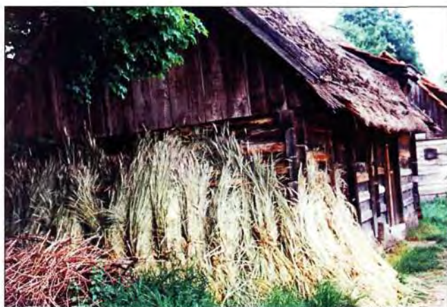
Slika 11. Raž pripremljena za obnovu krova.