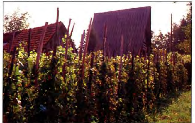
Slika 15. Alpski stil gradnje u vinogradima Kalničkog prigorja.

Kleti su se do danas sačuvale sraštene s prirodnim ambijentom, pa je njihova zaštita povezana sa zaštitom čovjekova okoliša, njihovo očuvanje vezano je uz naš opstanak u vlastitom prostoru i vremenu. Posljednji je trenutak da se ova graditeljska baština spasi od propadanja. Propašću vinogradarskih kleti propada i dio naše tradicije i naših korjena, propadamo i mi, postajemo nešto drugo. (slika 15)