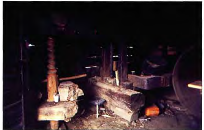
Slika 18. Starinska preša.

Potkalničke kleti uglavnom su prizemnice (rjeđe katnice) s podrumom (ili bez njega) iznad kojega se nalazi prostorija. Tavanski prostori služe za spremanje sijena, listinca (slika 17). Prostor odgovara čovjeku, njegovom ritmu; ritmu njegovog rada; njegovih ruku i teškog težačkog koraka. Pod je od utabane zemlje, a stijene su ožbukane glinom pomiješanom s pljevom. Strop se sastoji od središnje, noseće grede - tram pokriven daskama na kojima je sa gornje strane sloj gline pomiješane s pljevom zbog izolacije, a s donje strane daske su impregnirane dimom koji se tu godinama taložio od vatre koja se loži u sredini kleti. Kleti imaju jednu ili više prostorija, ovisno o potrebama. U kletima koje imaju jednu prostoriju, smješteni su svi sadržaji za prešanje, proizvodnju i čuvanje vina. Glavni sadržaj su lagvi 46 i preša, te pomoćni materijal potreban za rad u vinogradu s groždem i vinom. (slika 18)