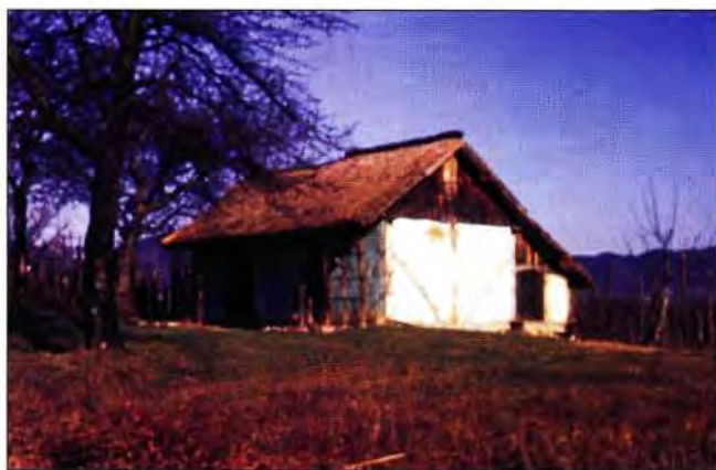
Slika 10. Sklad-galica će poslužiti i za bojanje kleti.