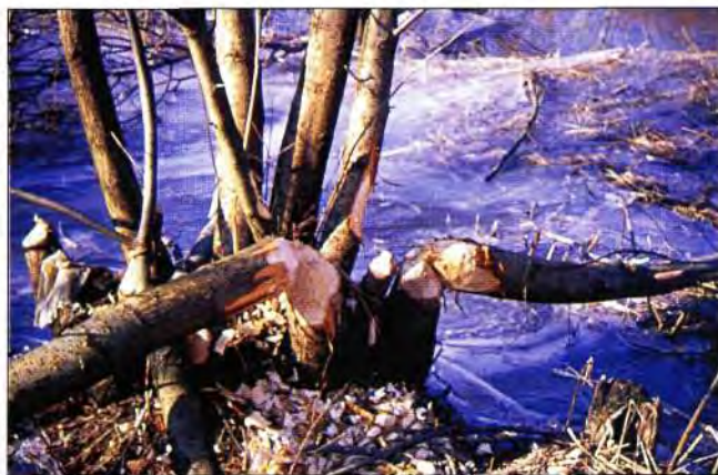
Slika 3. Porušena stabla vrbe potvrđuju nazočnost dabrova u Žutici Bild 3. Zerstörte Weidenbäume bestätigen die Anwesenheit der Bibers in Žutica

Navedena dva mjesta na kojima se ispuštaju dabrovi međusobno su udaljeni 9 km zračne linije, a kako dabrovi za komuniciranje koriste vodene površine, prateći tok rijeka Lonje i Česme, ti su objekti udaljeni 12,5 km.