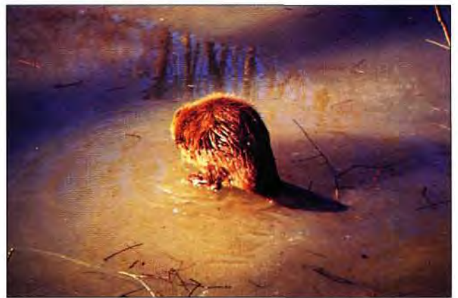
Slika 2. Dabar nakon ispuštanja na rukavac Lonja šće po zaleđenoj površini