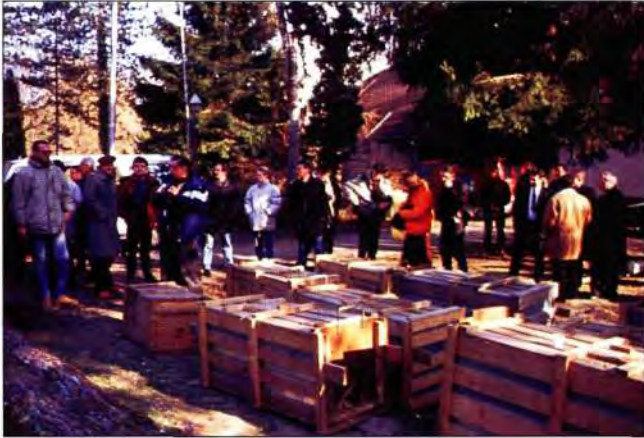
Slika 1. Sanduci s dopremljenim dabrovima uz nazočnost brojnih novinara u Žutici 05. veljače 1998.

Prije dopreme dabrova na mjestu predviđenom za ispuštanje, izradi se umjetna nastamba koja ima ulogu prihvata pristiglih jedinki. Umjetna nastamba sastoji se od jedne natkrite "prostorije" koja je približna kopija nastambe koju izgrade sami dabrovi. Umjetna nastamba ima dva otvora, jedan kroz koji se dabrovi ispuštaju u nastambu i koji se poslije ispuštanja zatvori, te drugi koji vodi iz nastambe u vodu i koji je natkriven granjem. Ispuštanje se odvija tako da se transportni sanduk s dabrovima donese do nastambe i postavi neposredno do otvora za ulazak dabrova u nastambu, potom se otvore vrata na sanduku i dabrovi mogu postupno prijeći iz sanduka u nastambu. Poslije izlaska dabrova u nastambu iz sanduka se oko nastambe ostavi slama i ostaci hrane koju su dabrovi jeli tijekom transporta, kako bi ih njihov vlastiti miris privlačio da se zadržavaju na istom prostoru duže vremena.