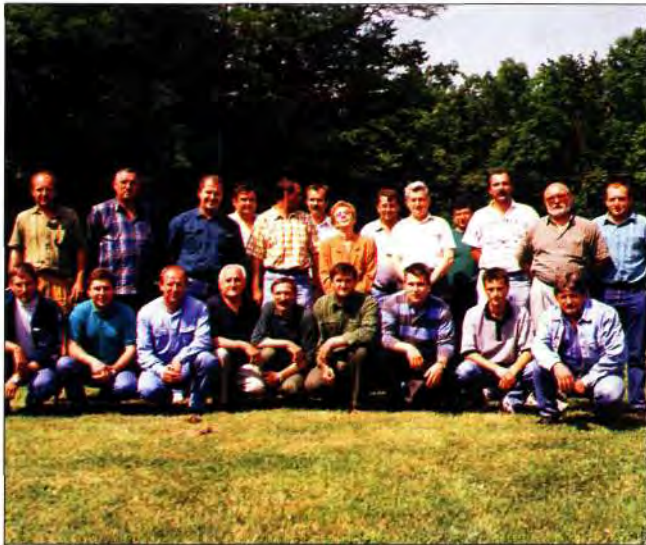
Slika 2. Polaznici seminara Uprave šuma Osijek s predavačima; Mačkovac, Đakovo, 17. lipanj 1997.