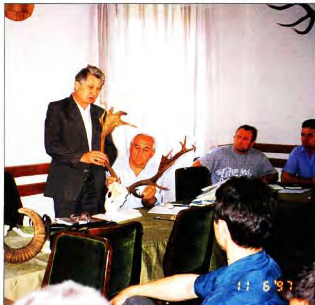
Slika 1. Međunarodna CIC formula za ocjenjivanje rogovlja jelena lopatara, kako zbog većeg broja mjernih elemenata tako još više zbog delikatnosti prosudbe točaka za dodatke i odbitke, kandidatima je zadavala najviše teškoća; sa seminaru u lovačkoj kući Lacići, Uprava šuma Našice, 11. lipanj 1997.

menom) dijelu ispita kandidati su morali pokazati potrebna znanja iz nastavnih jedinica predloženih programom seminara, posebice postupak i način ocjenjivanja trofeja te poznavanje i razumijevanje formula i naputaka CIC-a za ocjenjivanje. U praktičnom dijelu ispita, u grupama od po dva odnosno tri ispitanika zajedno, kandidati su morali ocijeniti po jedno rogovlje jelena običnog, jelena lopatara i srnjaka, kuke divojarca/divokoze i puževe muflona, kljove vepra te po jedno krzno i lubanju jedne od četiriju krupnih trofejnih krznašica.