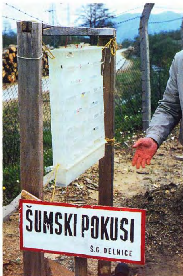
Slika 3. Feromonska klopka marke »Theysohn«. »Theysohn« pheromone trap.

uzrokom napada istih tih potkornjaka radi premale udaljenosti između klopke i stabala. Ta se udaljenost kreće od 5 m u starim sastojinama, do preko 15 m u mladim (u situaciji povećane opasnosti i preko 40 m!). Kada se radi o klopki kojom štitimo složaj trupaca od napada potkornjaka drvaša (recimo crnogoričnog ljestvičara) udaljenost od složaja mora iznositi do 50 m. Mjesto na kojem ćemo postaviti klopku u svrhu utvrđivanja brojnosti potkornjaka također ne bi trebalo biti pod neposrednim sunčevim osvjetljenjem, jer se radi tamne boje klopke feromonski disperzer previše zagrijava i hlapljenje feromona je prebrzo. Gustoća postavljanja klopki kod praćenja populacija potkornjaka varira od njihove brojnosti i ugroženosti sastojina prema njihovom napadu (monokulture nasuprot mješovitim crnogorično-bjelogoričnim sastojinama), a kreće se od 50 m na više. U našim uvjetima, gustoća postavljanja klopki je daleko manja jer je i opasnost od jačeg napada potkornjaka manja, ali u uvjetima dugotrajnog stresa (npr. sušnih godina), te kroničnog slabljenja