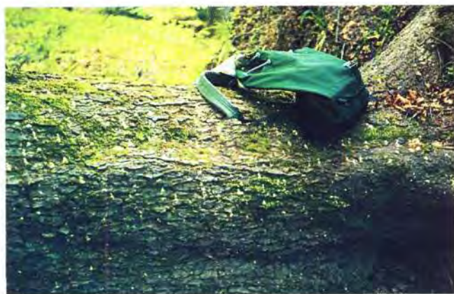
Slika 1. Žestok napad crnogoričnog ljestvičara ( Xyloterus lineatus ) na vjetrom izvaljenim jelovim stablima. Heavy attack of striped ambrosia beetle ( Xyloterus lineatus ) on windfelled fir trunks.

gdje se u sastojini nalaze prikladna stabla za njihov razvoj. 1