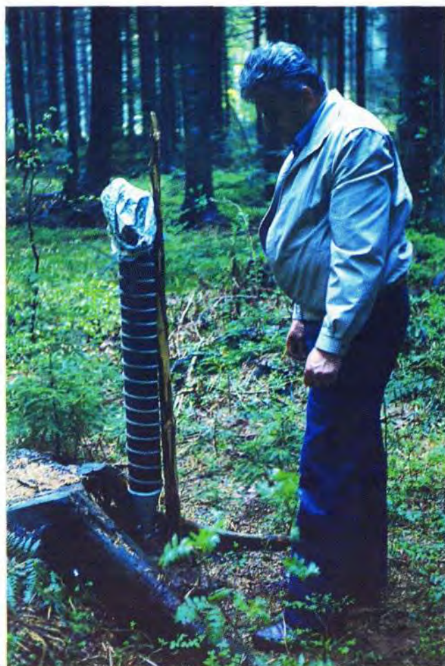
Slika 2. Feromonska klopka cjevastog oblika («Bakke-ova» ili «Norveška» klopka). »Bakke« or »Norwegian« type funneltrap desig.